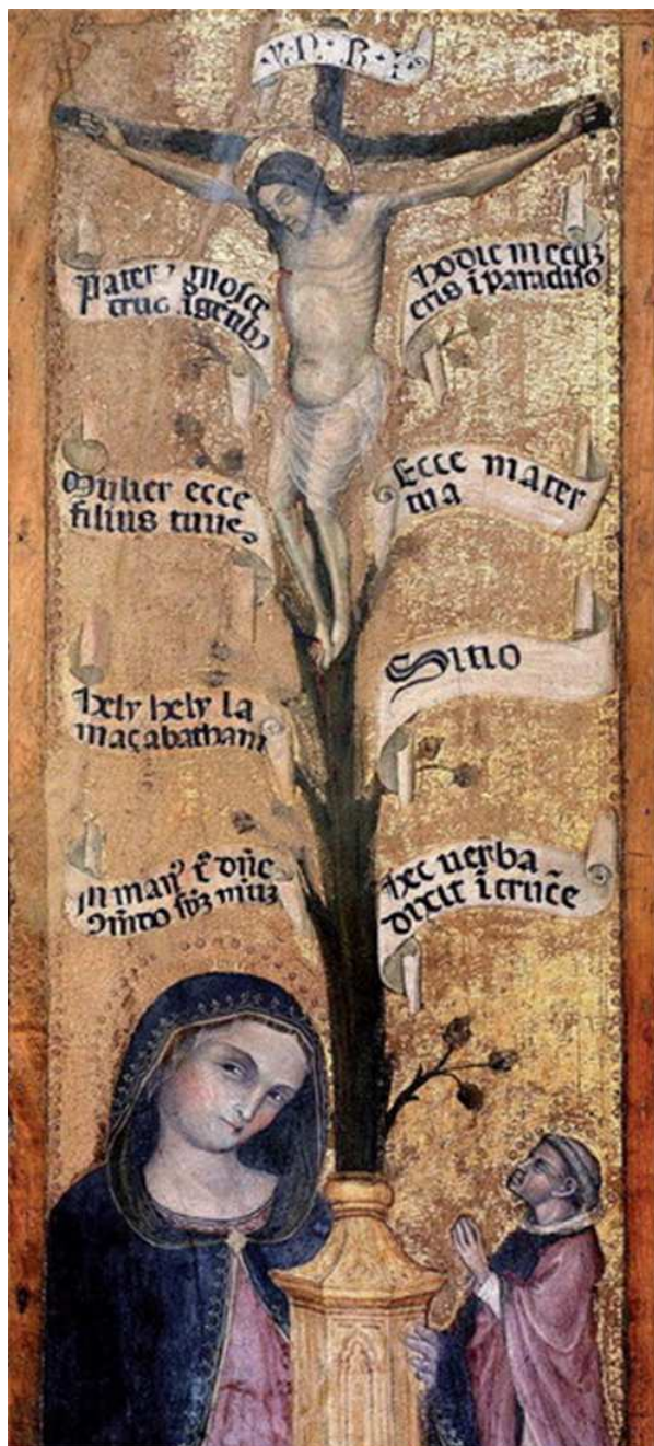
«L'Albero della croce ovvero delle Sette parole» (XIII secolo)

Lo stesso Ludolfo ricordava, però, che al suo tempo esisteva un'altra suggestiva elencazione ottoniana a coppia che possiamo così visualizzare: Ai peccatori: «Padre, perdona loro, perché non sanno quello che fanno». Ai buoni: «Oggi sarai con me nel paradiso». Ai